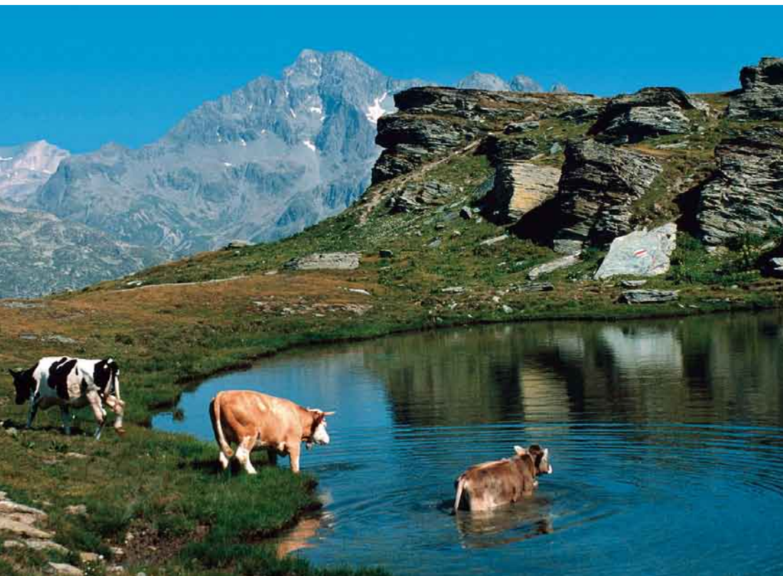
«Es lächelt der See, er ladet zum Bade» (Friedrich Schiller)